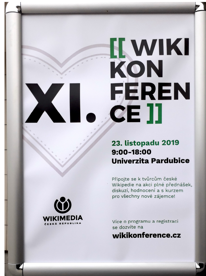
Wikikonference 2019 Univerzita Pardubice