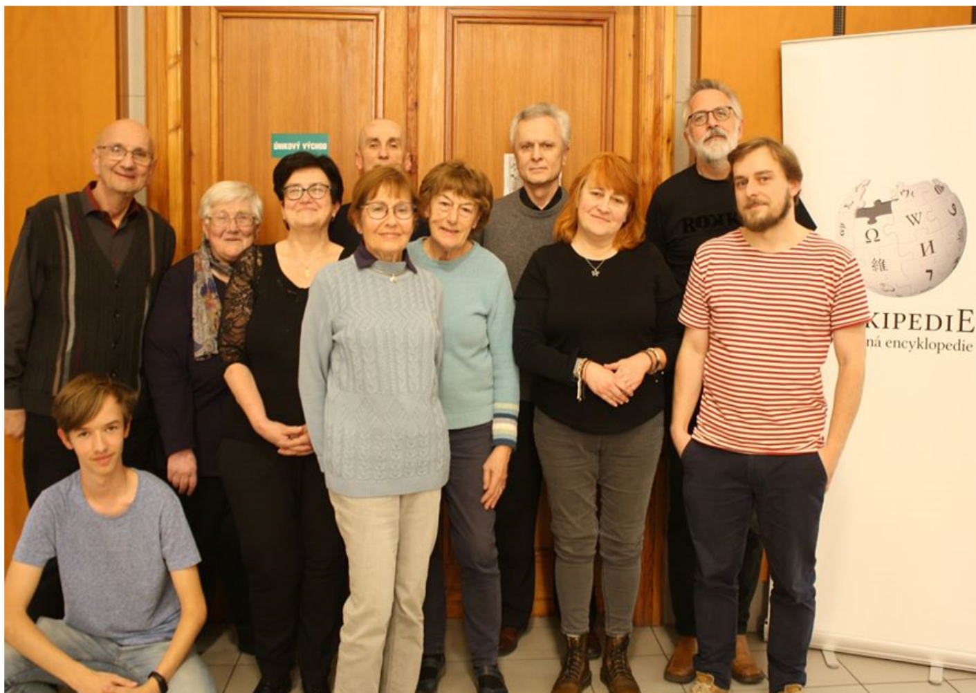
Kurz „Senioři píší Wikipedii“ – MKP, podzim 2019