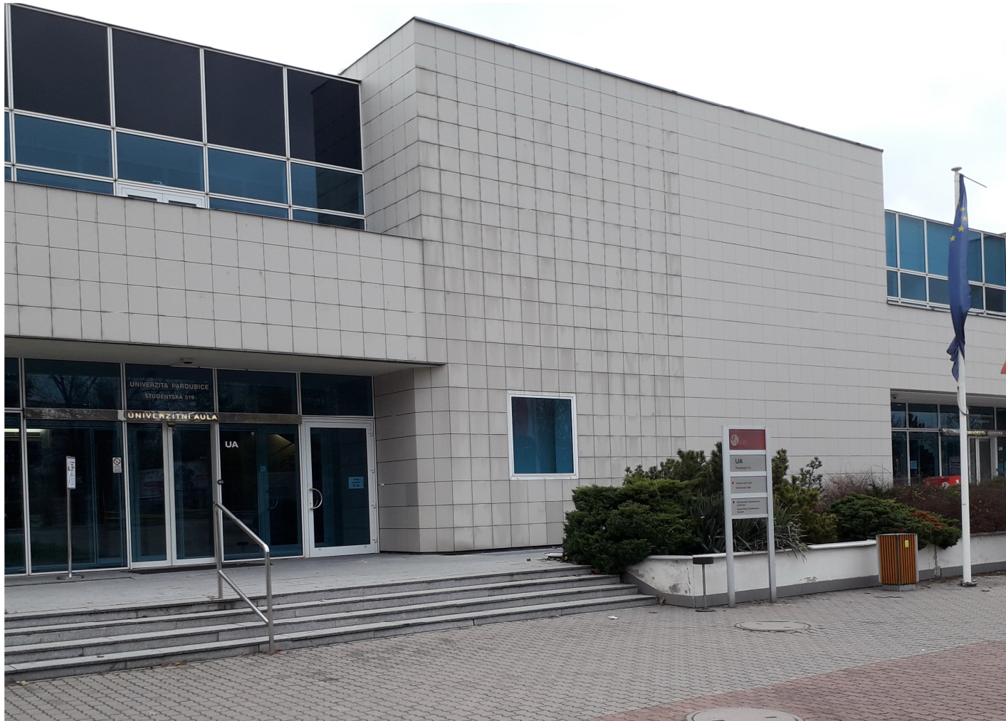
2019 Univerzita Pardubice