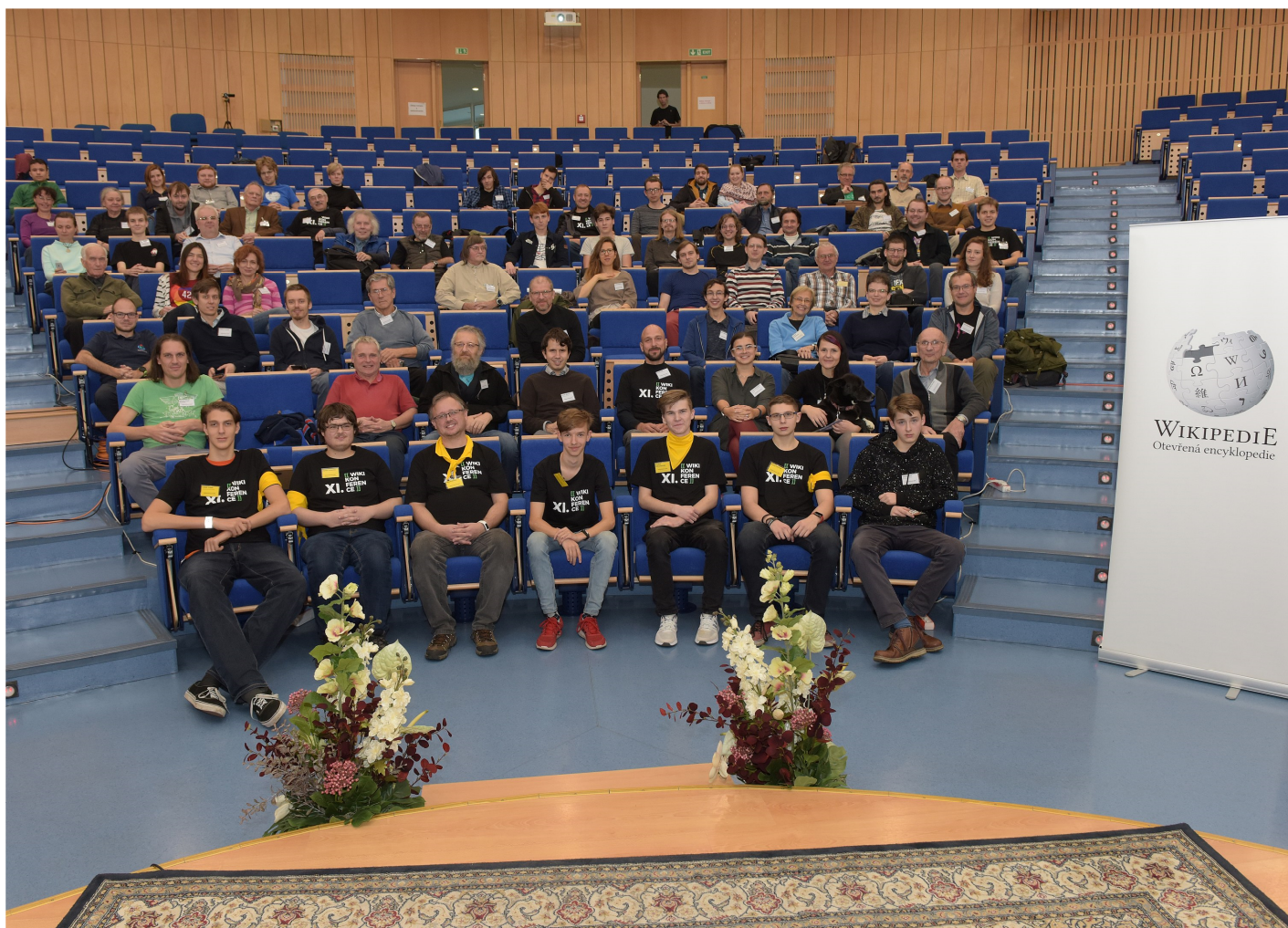
Autor: Adrian Zeiner, Univ. Pardubice Foto vytvoř. na zakázku v rámci služeb poskytnutých UP, CC BY-SA 4.0, https://commons.wikimedia.org/w/index.php?curid=84353361